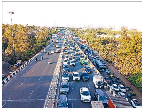
नई दिल्ली : ब्रिटानिया चौक से पंजाबी बाग गोल चक्कर की तरफ जाते समय लगा लंबा जाम।

गुरु गोबिंद सिंह इंद्रप्रस्थ विश्वविद्यालय (जीओएसआईपीयू) ने नए सत्र से अपने मौजूदा पाठ्यक्रमों में कुछ नए विषय जोड़े हैं। विश्वविद्यालय के स्कूल ऑफ लिबरल आर्ट्स ने राष्ट्रीय शिक्षा नीति (एनईपी) के तहत अपने 5 वर्षीय बीए-एमए लिबरल आर्ट्स कार्यक्रम में इतिहास, राजनीति विज्ञान और समाजशास्त्र के अलावा मनोविज्ञान को चौथे प्रमुख विषय के रूप में शामिल किया है। समाज में मानसिक स्वास्थ्य और कल्याण की बढ़ती जरूरतों को ध्यान में रखते हुए यह निर्णय लिया गया है। यह पाठ्यक्रम विद्यार्थियों को मानव व्यवहार की जटिलताओं को समझने में सक्षम बनाएगा और उन्हें विभिन्न सामाजिक, राजनीतिक, आर्थिक और सांस्कृतिक मुद्दों का व्यापक विश्लेषण करने के लिए आवश्यक सैद्धांतिक और विश्लेषणात्मक सहायता प्रदान करेगा।